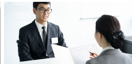
면접 요령 지도