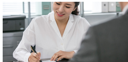
추천서 작성 지도